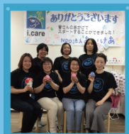
i.care サポーターズの ママたち。