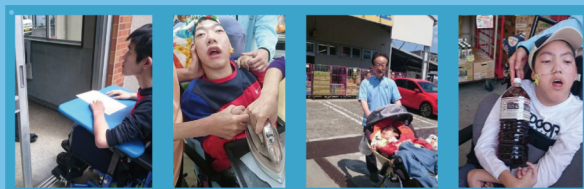
近所へのごあいさつ、アイロン掛け、地域の探索、買い物。 社会人1年生はとっても忙しいんです。