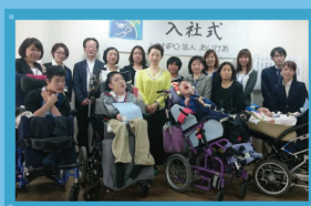
記念すべき入社式！