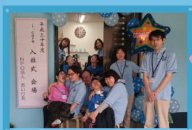
スタッフみんなでメンバーを 迎えます。