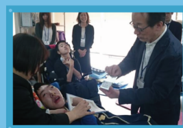
営業部長から名刺を手渡される 社会人1年生。