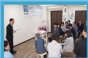
開所式にはたくさんの方が かけつけてくれました。