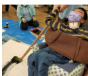
堂々たる書き初め！ 勢いのある辰が生まれました。