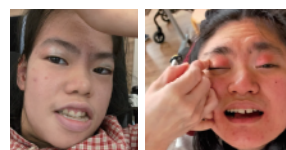
メイクで気分もあがる♪ かわいさ 3割増です。