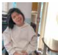
日の光も、笑顔もまぶしい！