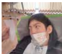
ゆったり距離を取れるようになったよね。