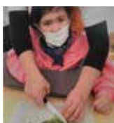
七草がゆかな？お雑煮かな？