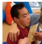
も、もしかして！ボーナスですか！？