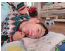
フロアが広がって視界も広がりました。

広がった分、歩く距離も増えてお掃除も一生懸命なのに、スタッフが痩せないのは何故かしら！🤔