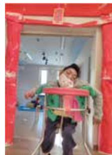
じゃん！あいけあ神社です。ご利益がありますように〜。

「コロナウィルスの影響で困難な状況が続く中、地域社会を支えている人達に向けた社会支援」としてドミノ・ピザ様からピザをプレゼントして頂きました！いつも頑張っているスタッフ達に、温かいピザと一緒に笑顔になれる瞬間を届けていただきました🎁